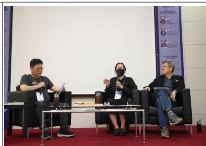
부천만화대상 수상작가 대담