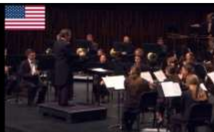
BYU 윈드 심포니 BYU Wind Symphony