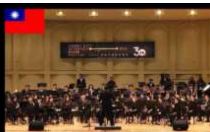
국립 차이이 대학 음악과 윈드 오케스트라 National Chaiyi University Department of Music Wind Orchestra