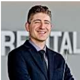
William Kinne Unique Wind Band Works That Encourage Collaboration, Imagination, and Artistic Risk- Taking