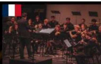
OHJS 스트라스부르 청소년 하모니 관현악단 Orchestre d'Harmonie des Jeunes de Strasbourg