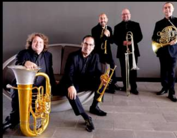
스페니쉬 브라스 Spanish Brass