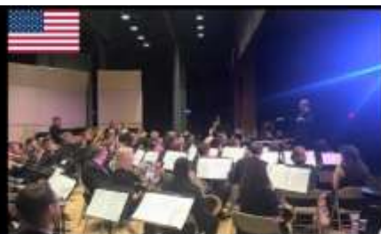
브루클린 윈드 심포니 Brooklyn Wind Symphony