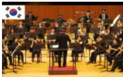
제주 서귀포 윈드 오케스트라 Jeju Seogwipo Wind Orchestra