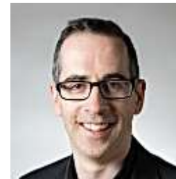
Bryan Griffiths Contemporary Australian Composition for Wind Band: A Coming of Age