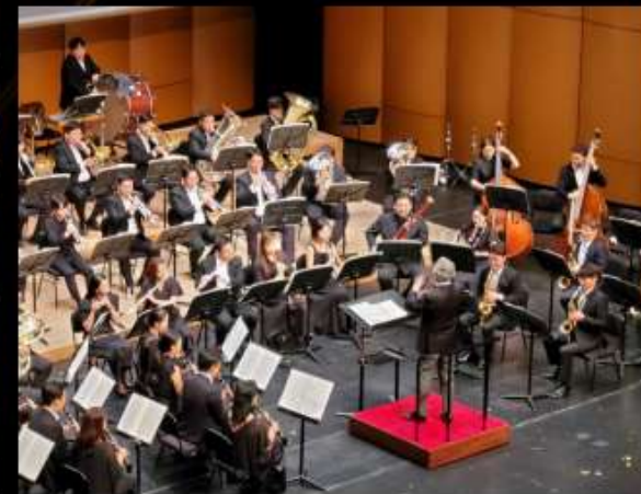
2024 WSABE 페스티벌 윈드 오케스트라 2024 Gwangju WASBE Festival Wind Orchestra