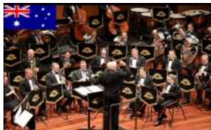
에들레이드 윈드 오케스트라 Adelaide Wind Orchestra

WASBE 예술위원회에서 엄선한 세계 최고의 WIND ORCHESTRA를 한자리에서 만날 수 있는 특별한 기회 WASBE 예술위원회에서 선정한 8개 국가 13개 팀의 공연으로 메인 공연 프로그램 구성