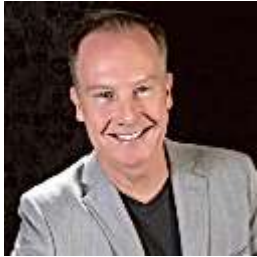
John Carnahan The Wind Band Sound – A Definitive Guide to Ensemble Intonation