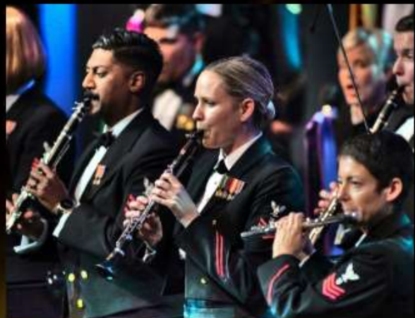
미해군 밴드 US Navy Band

세계최고 관악예술가들과 대한민국을 대표하는 WIND ORCHESTRA의 특별 공연을 기획 더욱 완성도 높고 볼거리와 즐길거리가 풍성한 제20회 WASBE 프로그램을 구성