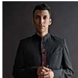
Trae Blanco Look like their SOUND: Two-step process to incorporating oral articulation into physical gesture, often lost in translation.