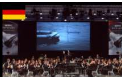
바덴뷔르템베르크 클러르 밴드 Landesblasorchester Baden-Württemberg