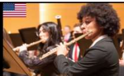
센트럴 워싱턴 대학교 윈드 앙상블 Central Washington University Wind Ensemble