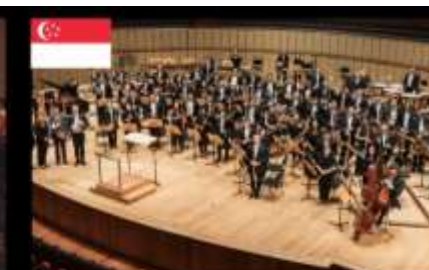
필하모닉 윈드 오케스트라 Philharmonic Wind Orchestra