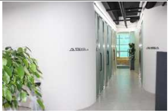
집필실 입구 및 복도