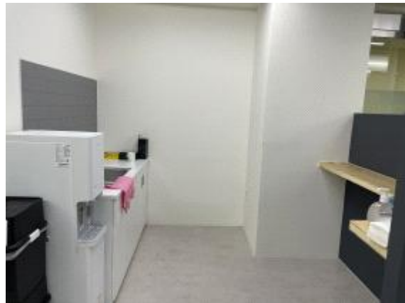
공용 탕비실(냉장고, 전자레인지 구비)