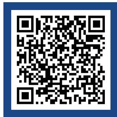
만화인 헬프데스크 접속 QR 코드

한국만화영상진흥원 홈페이지 '만화인 헬프데스크' 접속 https://www.komacn.kr