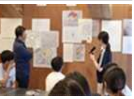
전문 스튜디오 (건축, 디자인 등)