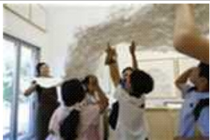
작가 작업실(작가 작업실, 레지던시 공간 등)

※ 행정구역 범위가 넓은 지역의 경우, 참여자 접근성을 고려해 통학차량 운영 가능