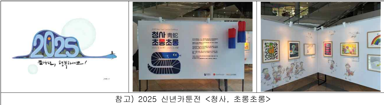
참고) 2025 신년카툰전 <정사, 초롱초롱>